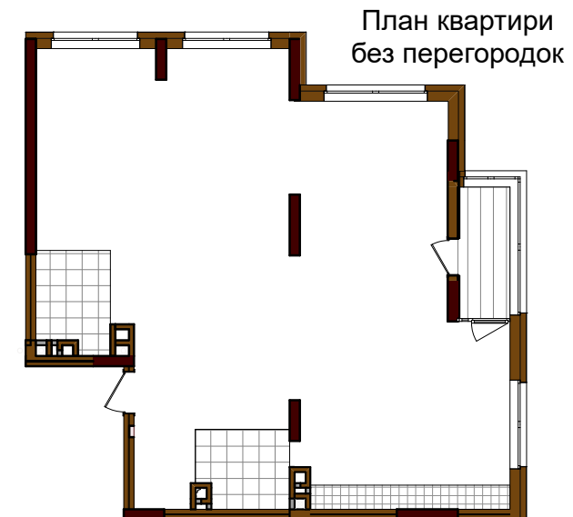
План квартири без перегородок